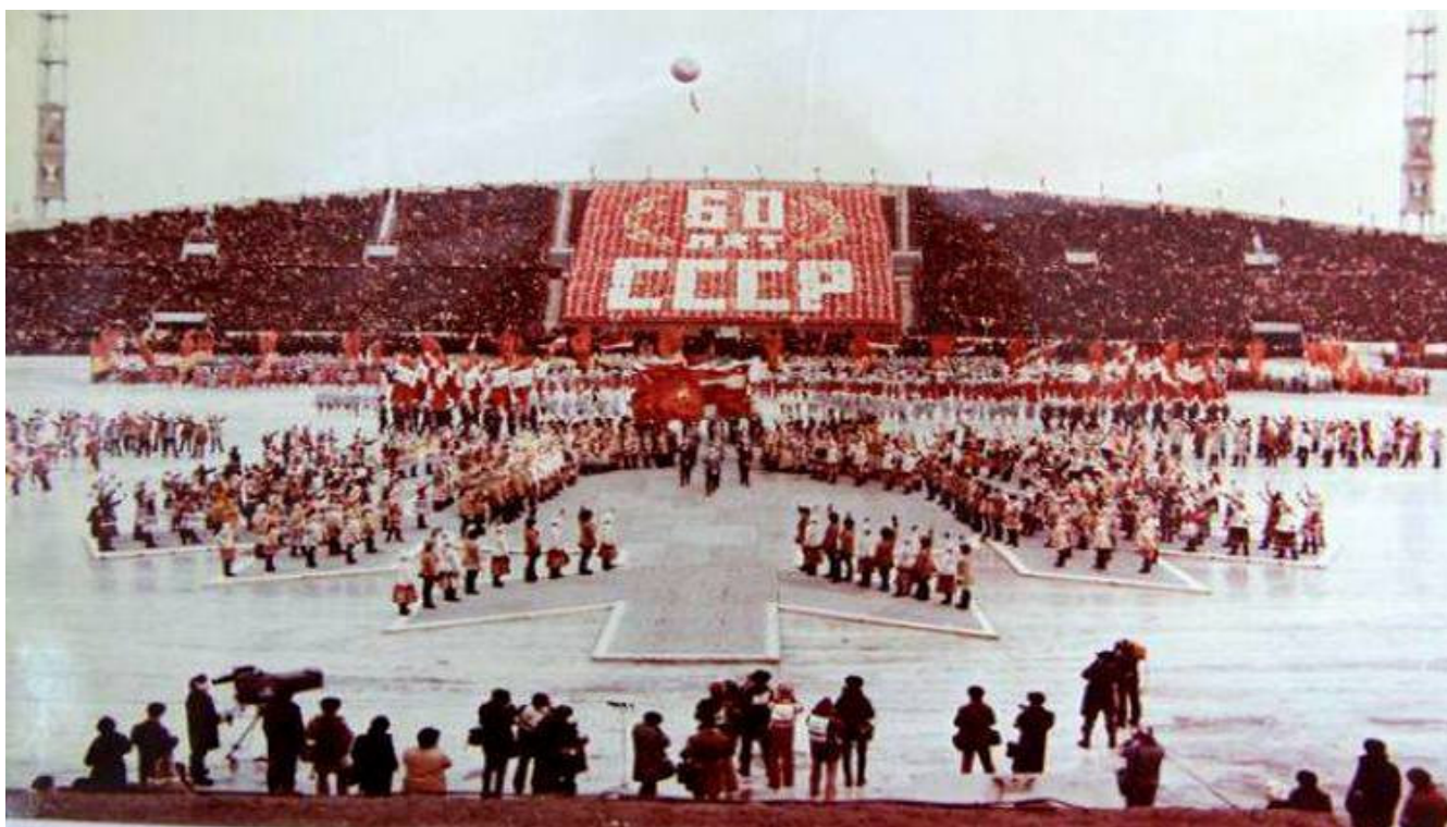
Церемония открытия VI советской зимней Спартакиады

V Зимняя Спартакиада народов СССР в 1982 году стала первым подобным событием в истории Красноярска. И местные власти очень боялись ударить лицом в грязь перед начальством из Москвы, выказавшим нашему городу столь высокое доверие. В Красноярске удалось своевременно построить все заявленные объекты спортивной инфраструктуры (пусть и ценой огромных трат и аврального труда рабочих), но оставалось еще одно испытание – церемония торжественного открытия спортивного праздника.