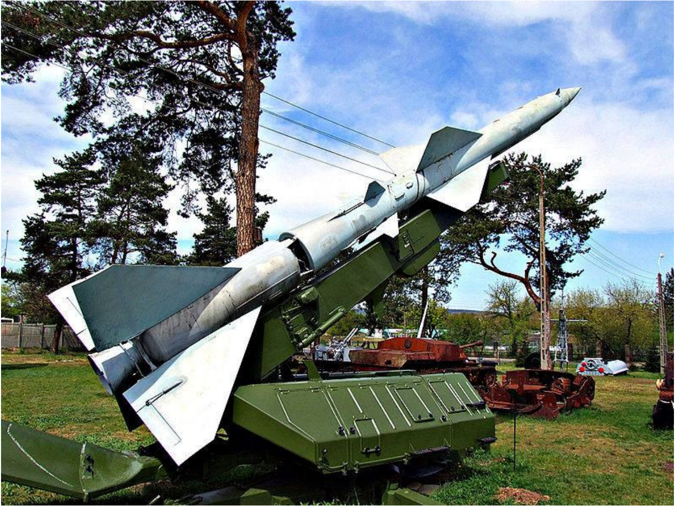
Подвижный зенитный ракетный комплекс С-75.

Предположительно, из подобного в окрестностях Красноярска и был сбит Ту-104 в 1962 году