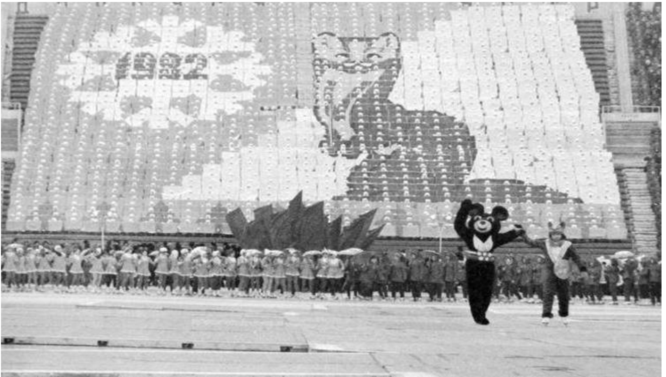
Талисман Спартакиады – соболёк Кеша

По разным данным, в «красноярской Ходынке» погибло от 6 до 20 человек, а еще порядка 100 – получили разные увечья. Поговаривали, что едва ли не половину пострадавших составили дети. Тем не менее, красноярское партийное начальство получило желаемый результат – трибуны стадиона были переполнены, праздник спорта состоялся, москвичи остались довольными, а смертельную давку в «лучших традициях» СССР предпочли не предавать огласке.