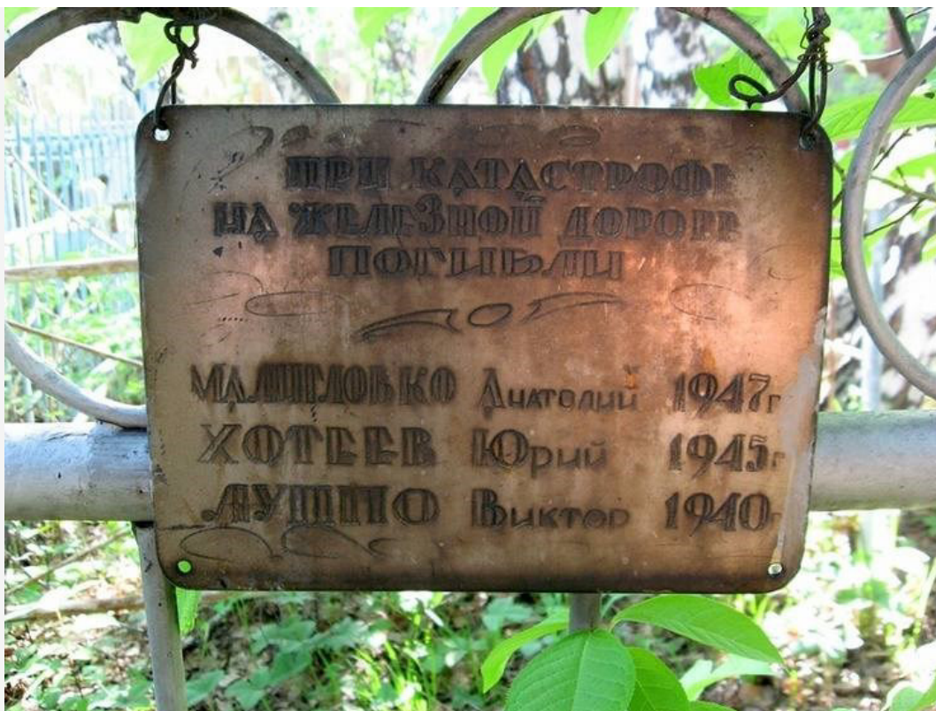
Одна из немногих уцелевших табличек с именами жертв