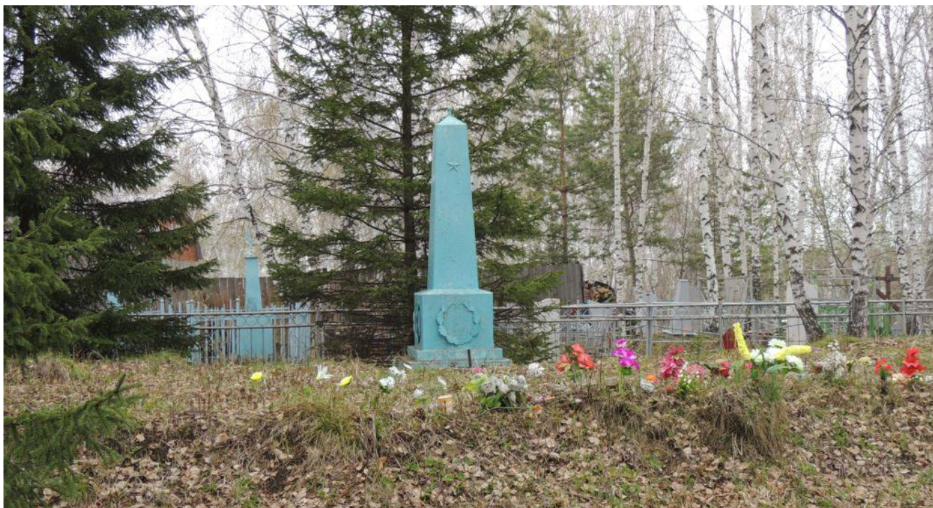
Братская могила жертв трагедии 1959 года

В итоге, только по официальным данным, которые обнаружены уже в постсоветское время, погибли 65 и получил увечье 61 ребенок и взрослый. Большинство жертв похоронят тут же, на мининском кладбище – в безымянной братской могиле.