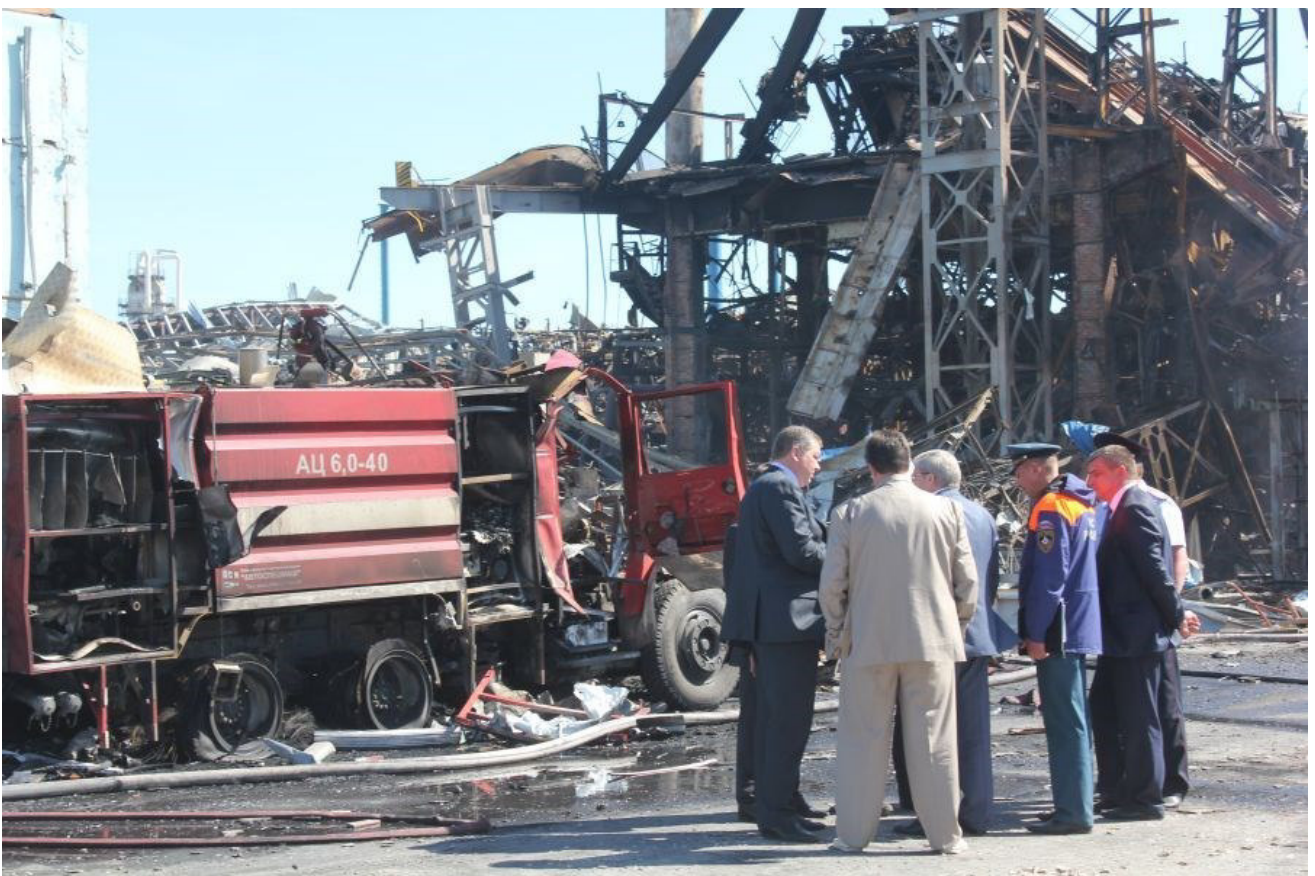
На месте взрыва