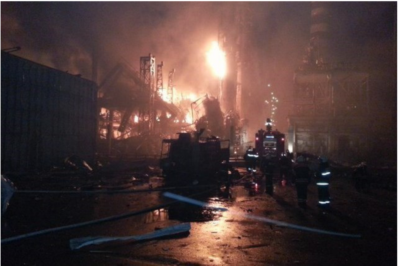
Пожарные расчеты на месте аварии